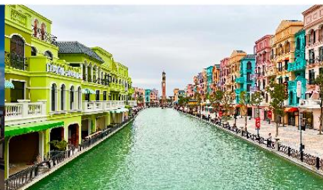
เมก้าแกรนด์เวิลด์ฮานอย

*ทางบริษัทฯ ขอสงวนสิทธิ์ในการสลับโปรแกรมทัวร์ตามความเหมาะสมขึ้นอยู่กับสถานการณ์หน้างาน โดยคำนึงถึงผลประโยชน์ของลูกค้าเป็นสำคัญ